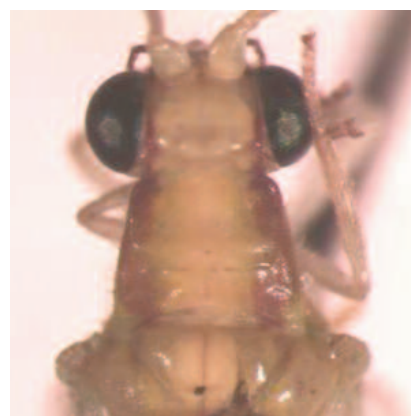
Figura 3. Chrysoperla asoralis . Cabeza y pronoto, vista dorsal.