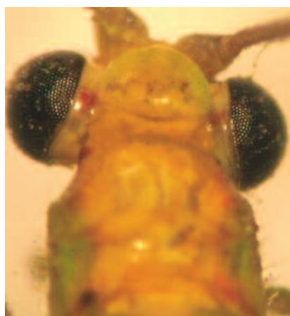
Figura 5. Chrysopodes (N.) polygonica . Cabeza y pronoto, vista dorsal.