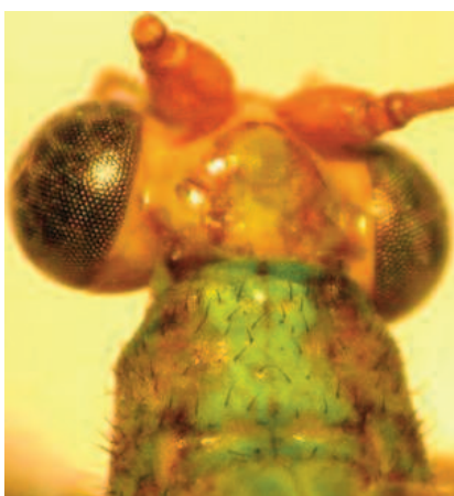
Figura 4. Ungla argentina . Cabeza y pronoto, vista dorsal.