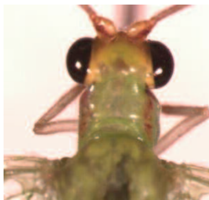
Figura 2. Chrysoperla defreitasi . Cabeza y tórax, vista dorsal.