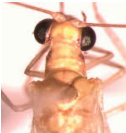
Figura 1. Chrysoperla externa . Cabeza y tórax, vista dorsal.